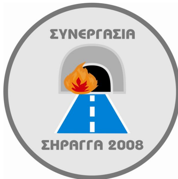
Σχήμα 1: Λογότυπο –Συμβολισμός