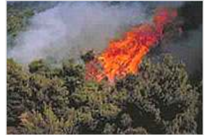
Πυρκαγιά στην Λαυρεωτική στις 16 Ιουλίου 1985